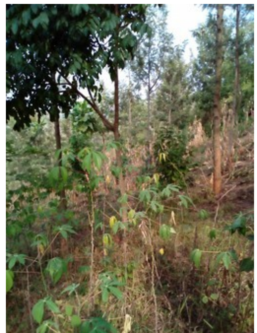
Die Bäume werden immer größer und dicker!