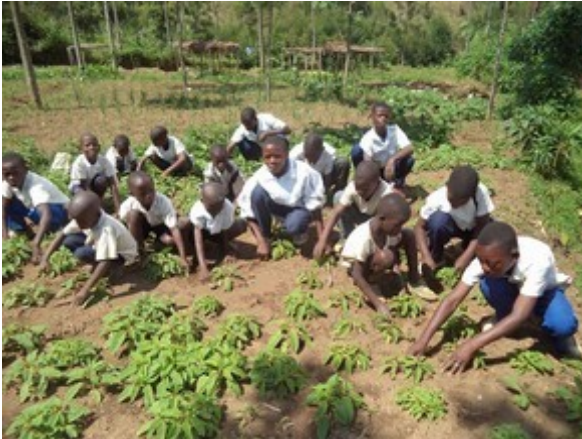
Marafiki wa Mazingira in Mushenyi lernen im Gemüsegarten.