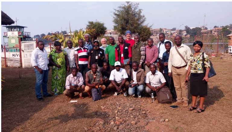
Vertreter der LHL-Partnerorganisationen im Süd-Kivu 2017

Die fünf Organisationen haben sich mit fünf weiteren in der Aufforstung aktiven Organisationen zu einem Dachverband der Forst-NGOs zusammengeschlossen („RESEAU CONCOLAIS POUR LA REFORESTATION, R.C.R./Sud Kivu »), um gegenüber den staatlichen Behörden als Lobbygruppe mit einer Stimme sprechen zu können. Dieser Dachverband organisiert gemeinsame Versammlungen und Treffen, um Interessen zu koordinieren.