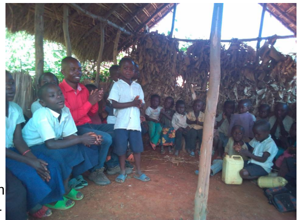
Marafiki wa Mazingira Mushenyi

Wie lange wir allerdings noch die Jugendprojekte fördern können wissen wir nicht. Auch hier muss ein „nachhaltiges“ Konzept entstehen und das kann auf Dauer nur lauten: Die Naturfreundejugend muss sich selbst organisieren!